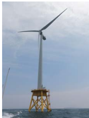
NEDO 洋上風力発電システム実証研究