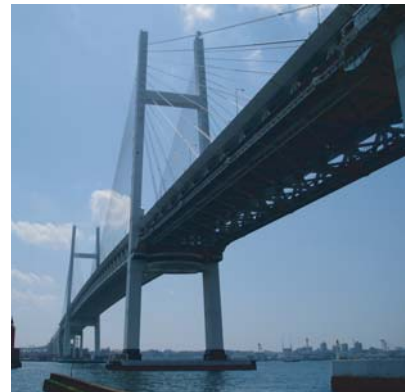
横浜ベイブリッジ