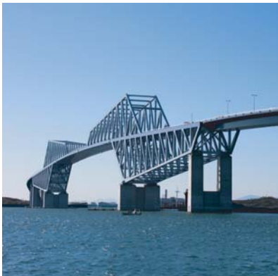
東京ゲートブリッジ